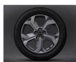
18" álfelgur (215/55R18) fyrir Prime-Line og Exclusive-Line