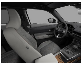
Modern Confidence áklæði í Advantage og Makoto útfærslu