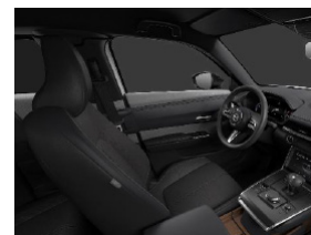
Urban Expression áklæði í Makoto útfærslu