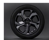
18" álfelgur (215/55R18) fyrir Advantage og Makoto