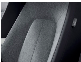
Áklæði í Prime-Line og Exclusive-Line útfærslu