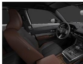
Industrial Vintage áklæði í Advantage og Makoto útfærslu